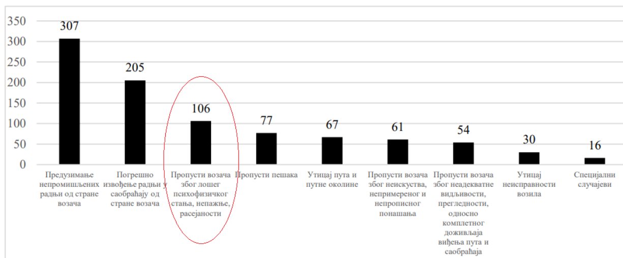
Слика 1. Најчешћи узроци и грешке које доводе до смртних последица у саобраћају. Република Србија, 2021. (1)

Сваке године у саобраћајним несрећама погине 1,2 милиона људи широм света, 20-50 милиона буде повређено, а више од 40% свих жртава је млађе од 25 година живота. Непромишљене радње (укључујући прекорачење брзине) су водећи узрок смртних исхода саобраћајних несрећа у Србији (64%), док лоше психофизичко стање (укључујући вожњу под утицајем алкохола и/или лекова који утичу на психофизичке способности) заузима треће место са 22%.